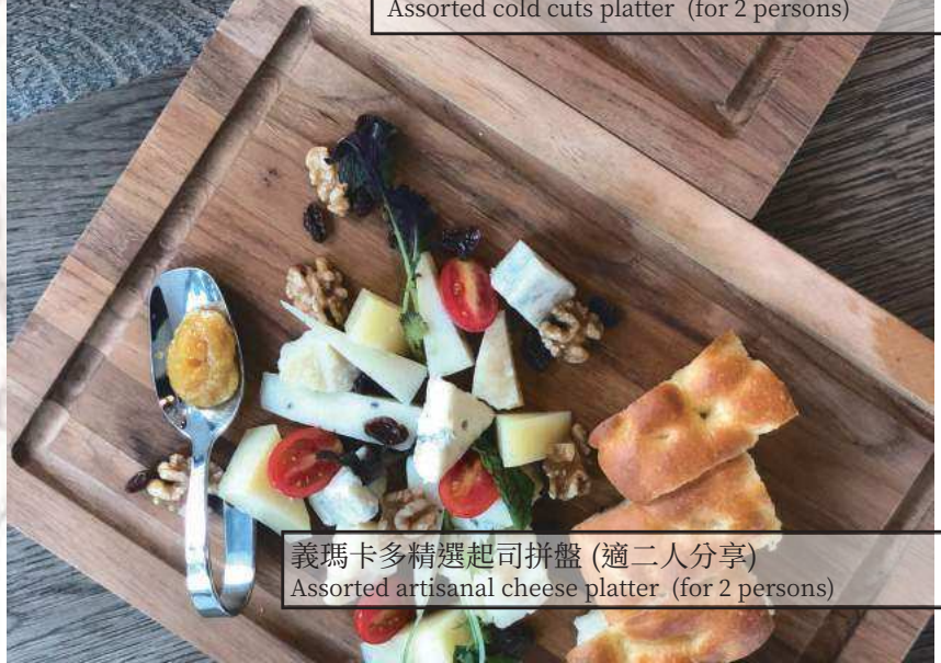
義瑪卡多精選起司拼盤 (適二人分享) Assorted artisanal cheese platter (for 2 persons)