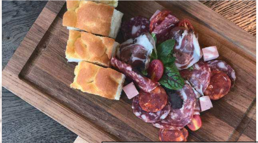
義瑪卡多精選風乾肉品拼盤 (適二人分享) Assorted cold cuts platter (for 2 persons)