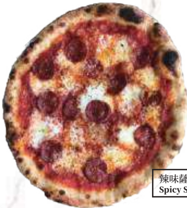
辣味薩拉米披薩 NT$390 Spicy Salami