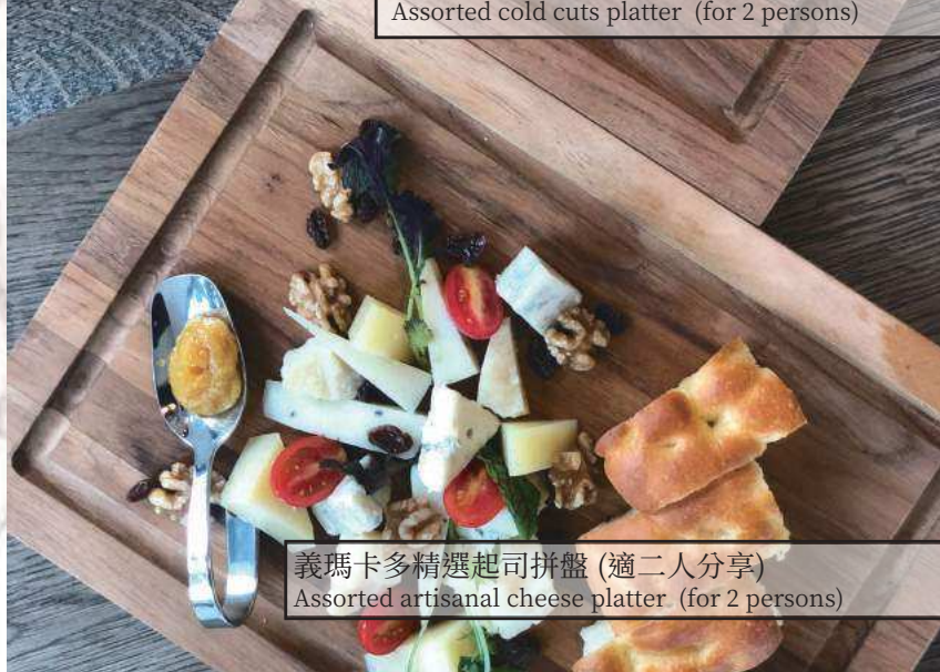
義瑪卡多精選起司拼盤 (適二人分享) Assorted artisanal cheese platter (for 2 persons)