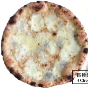
四種起司披薩(素) NT$450 4 Cheeses(V)

Black truffle cream, Fiordilatte mozzarella, taleggio TARTUFARA