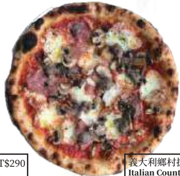
義大利鄉村披薩NT$420 Italian Country Style