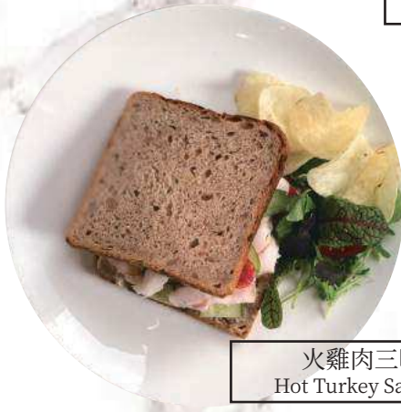
火雞肉三明治 Hot Turkey Sandwich