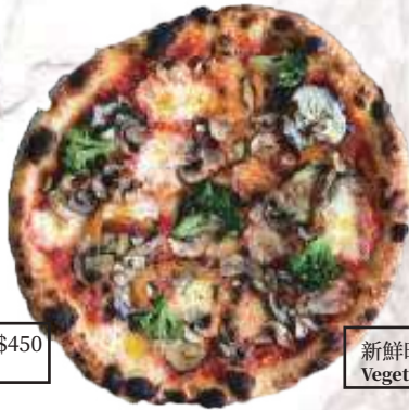
新鮮時蔬披薩(素) NT$420 Vegetable (V)