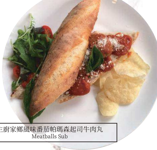
主廚家鄉風味番茄帕瑪森起司牛肉丸 Meatballs Sub