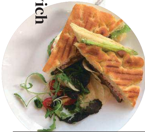
私房義大利香料肉排帕尼尼 Homemade Italian Homemade Panino