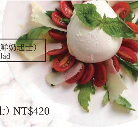
經典義大利國旗沙拉(水牛鮮奶起士) Buffalo Mozzarella Salad