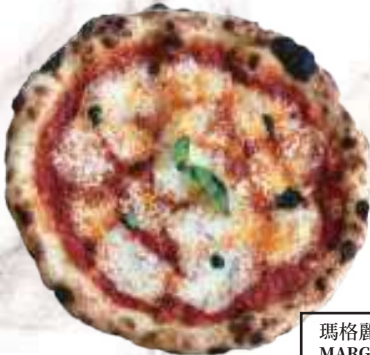
瑪格麗特女王披薩(素)NT$290 MARGHERITA (V)

Fiordilatte mozzarella, ham, button mushrooms, house-made Italian sausage, extra-virgin olive oil