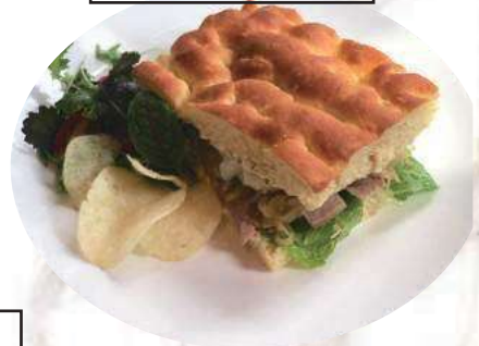
鮭魚三明治 Tuna Sandwich